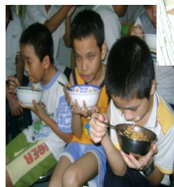
Hình dưới: các em mù mồ côi ở BS

VOSA thường xuyên nấu các bữa ăn ngon đem đến phát cho các em, và hỗ trợ tiền mặt phụ giúp vào việc nuôi các em.