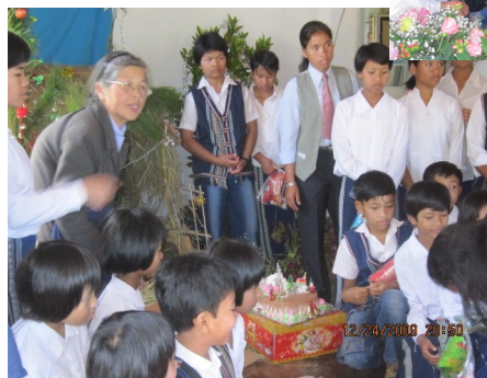
Trẻ mồ côi tại nhà tình thương nhũ đồng xã Tà Nung

Tặng phòng khám từ thiện Vạn Thành 1 thùng thuốc. Phòng khám này cũng do các soeur phụ trách. Phòng khám mở cửa 2 ngày một tuần, khám bệnh và cấp phát thuốc miễn phí cho người nghèo. Phòng khám tọa lạc tại xã Vạn Thành, phường 5, thị xã Đà Lạt, mỗi tuần phục vụ được khoảng 200 bệnh nhân.