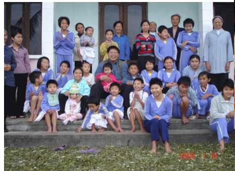
Trẻ mồ côi + khuyết tật tại Trung Tâm Hy Vọng Vinsente ở Quảng Bình.

*** Trung Tâm Hy Vọng Vinsente ở Quảng Phương- Quảng Trị- Quảng Bình được lấy tên của cha thánh tử đạo Vinsente Nguyễn Thị Điềm, do các soeur dòng Mến Thành Giá lập ra năm 1990, đến nay đã nuôi được 50 em mồ côi + khuyết tật. Vì 4 căn phòng khách của nhà dòng quá chật hẹp để nuôi