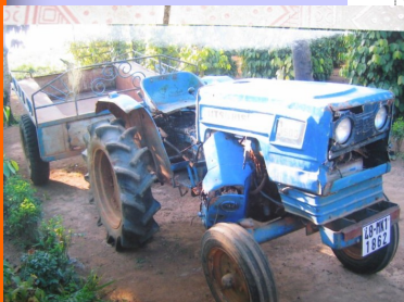
Máy xới cỏ tặng cho Diệu Pháp

Vừa rồi có con lũ thế kỷ xảy ra tại Quảng Bình, chắc nơi này bị thiệt hại rất lớn.