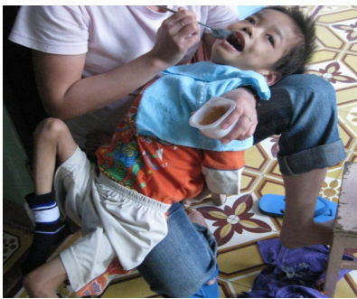
Trẻ mồ côi khuyết tật tại mái Ấm Hy Vọng xã Thủy Biều, Huế