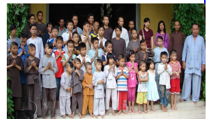
VOSA, các thầy, và trẻ mồ côi chùa lá

Năm 2009, VOSA đã tặng các em một bữa cơm chay và các phẩm vật như giày dép, đồ chơi, tập vở, bánh kẹo cùng với 200 USD để phụ nuôi các em.