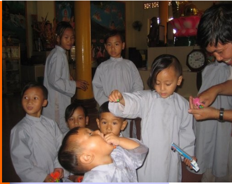
Trẻ mồ côi tại chùa Ngọc Tuyền