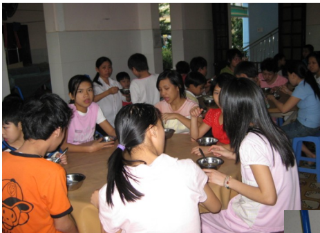
2009 VOSA chỉ cấp 4 học bổng cho 4 em mồ côi

Các cháu khuyết tật phần lớn là câm điếc, còn lại là hội chứng Down, hoặc chậm phát triển. Các cháu được các soeur chăm sóc rất chu đáo sạch sẽ.