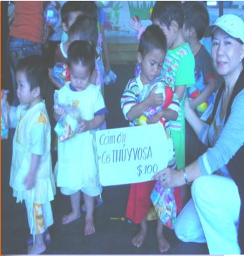
Trẻ mồ côi tại Trung Tâm nuôi dưỡng Trẻ Mồ Côi Sơ Sinh Quảng Nam

Trong một dịp tình cờ cứu được một cô gái đi nhai tự tử vì đã lỡ có bầu với một chàng sở khanh, từ đó các soeur ở mái ấm Hy Vọng đã mở rộng vòng tay đón nhận các cô gái lỡ làm này. Các cô tìm đến mái ấm sẽ được nuôi dưỡng cho đến khi đứa bé cứng cáp. Các cô có thể bồng con đi hoặc để lại đứa bé cho các soeur rồi bắt đầu lại cuộc đời mình mà không ai biết đi vãng đâu buồn đã qua. Khi ở trong mái ấm Hy Vọng, các cô được ở một khu riêng biệt và chỉ có nhiệm vụ giặt giũ, nấu nướng cho trẻ mồ côi tại đây. Cho đến nay, các soeur đã cứu vớt được mười mấy cô gái như vậy, giúp cho họ có niềm tin và hy vọng cho một cuộc đời mới.