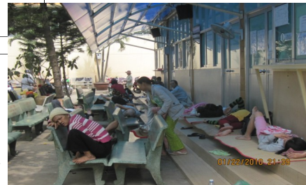
Đời sống của bệnh nhân ung thư ở hành lang bệnh viện ung bướu

hóa trị nữa nhưng không biết xoay đâu đủ tiền nên định nằm nhà chờ chết. Chúng tôi thấy hoàn cảnh như vậy mới giúp chị 200 USD cho 2 lần hóa trị tiếp.