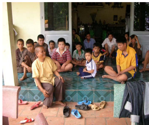
VOSA và trẻ mồ côi tình thất Long Thành

Quý vị vào website sẽ thấy đầy đủ hình ảnh, video clips, bản tin của VOSA trong những năm vừa qua.