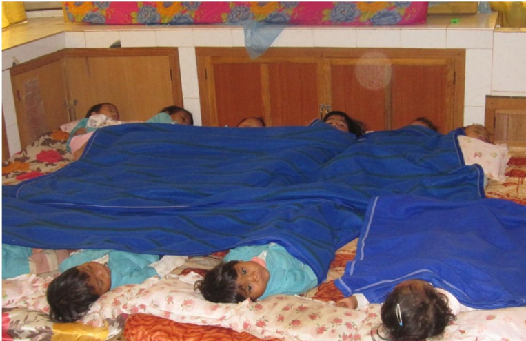
Các cháu suy dinh dưỡng tại nhà nuôi trẻ Tà Nung đang ngủ trưa

Các em nh t i ây ít ti p xúc v i ng i i nên còn nhút nhát, nh ng các em có tài ca múa, r t thích hát, và r t ngoan, hy v ng khi các em ra i s là nh ng công dân t t cho xã h i.