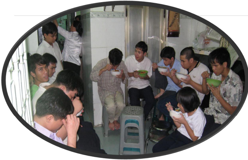
Các em khuyết tật ở Bùng Sáng đang dùng bữa trưa do VOSA tặng

ăn, n i ng tr a. V y mà m i khi chúng tôi n t ng các em b a n, em nào vào v trí ó, không chen l n, không chỉ m ch c a nhau, r t tr t t và r t yêu th ng nhau.