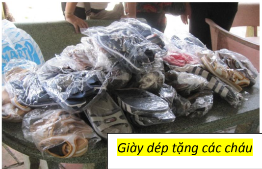
Giày dép tặng các cháu

N m trong l con h m t i cây s 67 ng i Bà R a V ng Tàu là t m c a 31 cháu m côi khuy t t t. Lúc u ch là m t am nh do s cô Di u Th y l p ra có ch tu hành m t mình nên r t ch t ch i.