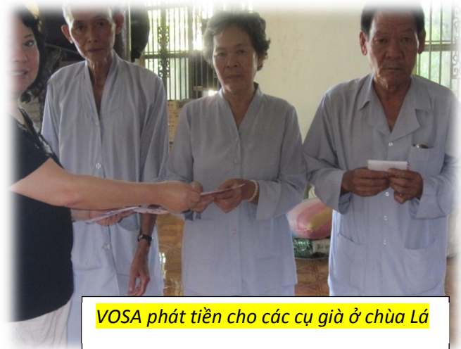
VOSA phát tiền cho các cụ già ở chùa Lá

Chùa Lá là m t ngôi chùa n m trên l cù lao nh huy n Nhà Bè, b n b là kênh r ch và lá d a n c vây quanh. Khi VOSA b t u giúp tr m côi t i ây (có l ã h n ch c n m), chùa c t b ng tre, vách b ng lá d a n c, mái thì có ch b ng tôn, có ch b ng lá, nền bằng đất nện. L i i vào chùa ch là chi c c u p p b ng tre b c ngang con r ch. Thầy trò x n qu n l i bùn trong mùa m a và i mua t ng gánh n c ng t trong mùa n ng, mu i quanh ch ng i t ng àn bu en.