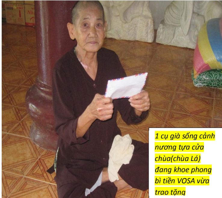
1 cụ già sống cảnh nương tựa cửa chùa(chùa Lá) đang khoe phong bì tiền VOSA vừa trao tặng

Có nh ng ng i h i ngo i xót xa cho nh ng c già ang s ng trong nh ng nursing home n c ngoài, nh ng n u các quý v ó c nhìn t n m t cu c s ng c a các c già VN ang