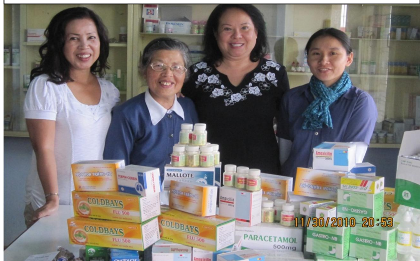
VOSA, các soeur phụ trách phòng khám và thuốc VOSA tặng