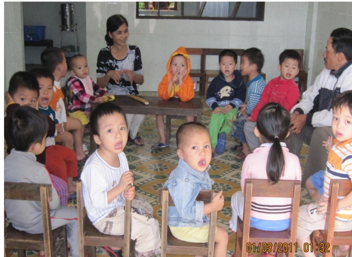
Lớp học mẫu giáo cho trẻ bình thường tại mái ấm Hy Vọng

Các cô gái mang b u b b r i c ng c các soeur nuôi t t n khi m tròn con vuông r i mang con i hay l i cho soeur tùy ý. Các em gái này c m t n i riêng bi t (vì m c c m, không mu ng p ng i ngoài), hàng ngày, các em ch lo vi c n u c m, gi t gi cho tr khuy t t t. Ch ng trình này c a các soeur t khi l p ra n nay ã c u s ng c bi t bao cô gái l l m vì các cô trong lúc tuy t v ng ch mu n i t t . Nhi u ng i sanh con ra c ng i