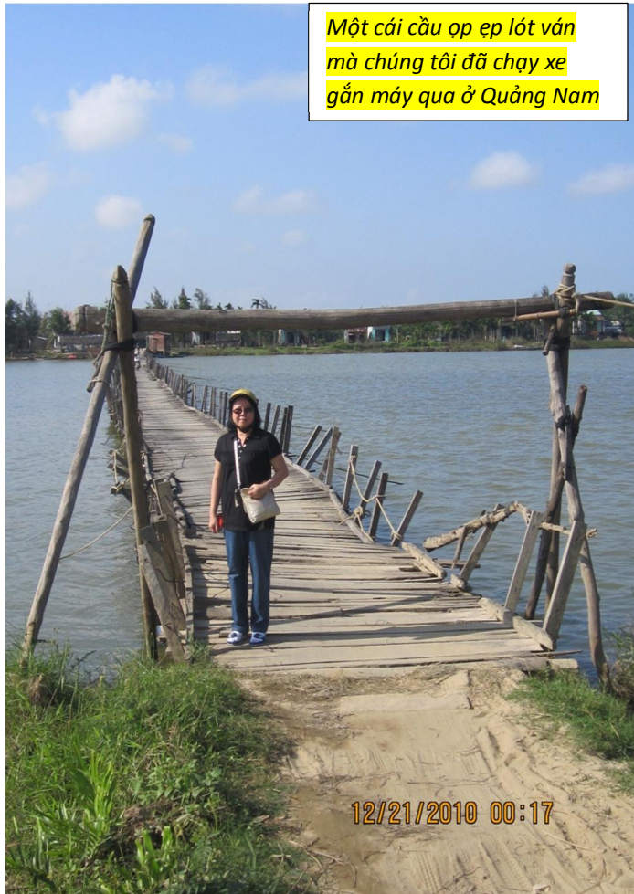
Một cái cầu ọp ọp lát ván mà chúng tôi đã chạy xe gắn máy qua ở Quảng Nam

Miền miền Trung, chúng tôi các thí nghiệm viên địa phương dùng xe gắn máy chở các gia đình cần giúp. Có khi phải dùng đò qua sông, có khi phải qua nhúng cây chuối ghép bằng các thanh tre mảnh, có khi phải đi trên những con đường tạm bợ mô gà lỵ lỵ.