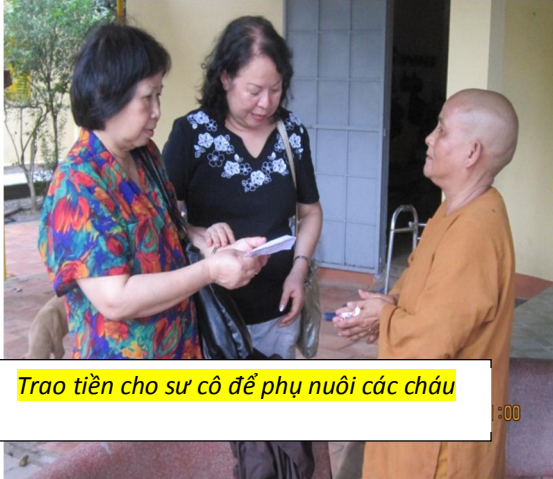
Trao tiền cho sư cô để phụ nuôi các cháu

mang liams cô, r i tr con tâm th n b li ng ngoài ng, r i hài nhi h n b b l i tr c c ng am. M t mình s cô tr ng tr t, làm t ng, làm chao nuôi ám tr này. Nay thì v i s góp s c c a các nhà h o tâm, cái am nh xú ã c xây thêm 2 dãy nhà tr t l p tôn cho các cháu .