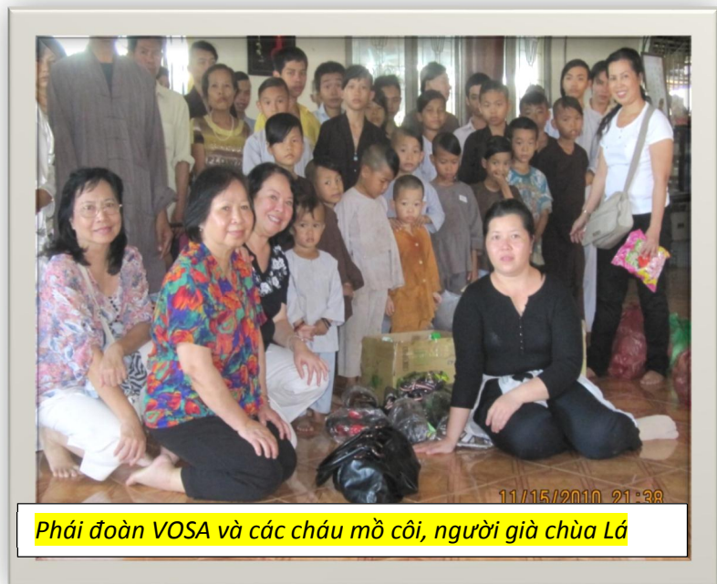
Phái đoàn VOSA và các cháu mồ côi, người già chùa Lá

Các cháu trai lớn này bắt đầu đi học và nhận được sự chú ý của xã hội. Các cháu tìm kiếm việc làm ở chùa Lá, phần lớn gia đình ở có vấn đề về kinh tế, họ cha mẹ nghèo khổ, họ cha mẹ tàn tật, nhà bà mẹ nghèo khổ không nuôi được các cháu, họ cha mẹ lang thang kiếm sống, họ cha mẹ không muốn sống lang thang nữa, khi tìm được việc làm, họ cha mẹ giao tay cho xã hội. Khi các em đã 18 tuổi, họ cha mẹ đi tu hay ra ngoài thì tùy ý, không bắt buộc.