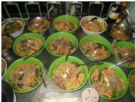
Bữa nui xào thịt bò VOSA tặng các em

Ti n cho các em i h c, ti n n cho h n 60 con ng i ây u d a hoàn toàn vào s óng góp c a các nhà h o tâm. Có m t c s làm massage nh Chung C n Quang c l p ra các em l n có ngu n thu nh p t nuôi b n thân. Tuy nhiên, vì các em mù nên không có c nhi u khách hàng, khách n massage ph n l n ch là các ông bà c ãng quanh xóm.