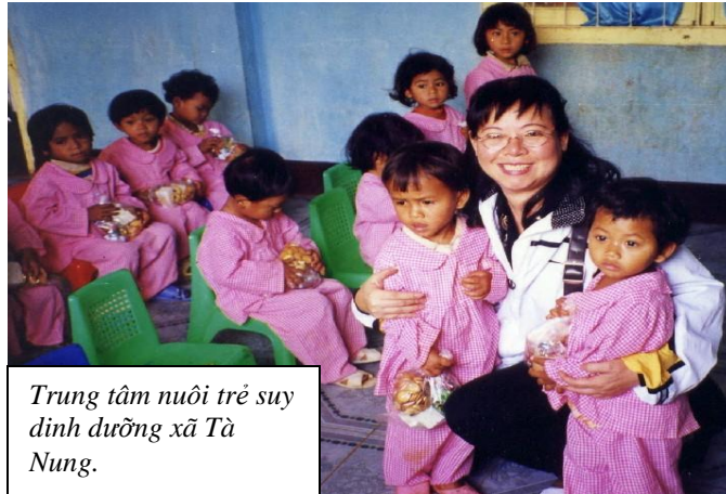
Trung tâm nuôi trẻ suy dinh dưỡng xã Tà Nung.

Năm 1999, VOSA bắt đầu chương trình học bổng bảo trợ nhằm giới thiệu các em học sinh nào có hoàn cảnh thật nghèo khổ đến trực tiếp với người bảo trợ. Người bảo trợ sẽ cấp học bổng mỗi năm ít nhất $100/học sinh cho đến khi em đó học xong lớp 12. Số tiền này sẽ đủ cho đóng tiền học phí, mua sách vở, và may đồng phục đi học. Cuối mỗi niên học, em học sinh được bảo trợ có bốn phen phải báo cáo kết quả học tập đến người bảo trợ. Thêm vào đó, hai bên sẽ viết thư thăm hỏi lẫn nhau và người bảo trợ có thể thăm “đưa con nuôi tinh thần” của mình khi có dịp về thăm Việt Nam. Với sự giúp đỡ đặc biệt này, các em được bảo trợ sẽ có nhiều cơ hội phát triển năng khiếu và rõ ràng sẽ thay đổi được cuộc đời các em.