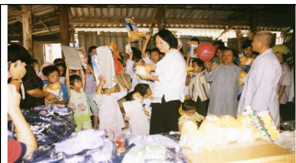
Tặng quà cho 165 trẻ mồ côi chùa Diệu Pháp, Long Thành