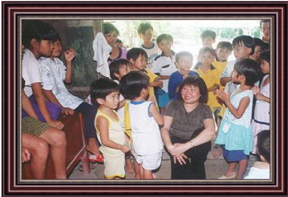
Hình trên: phái đoàn VOSA và các em mồ côi chùa Diệu Pháp, Long Thành năm 2001, xin xem thêm hình ảnh năm 2001 ở trang kế tiếp.