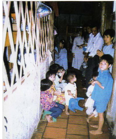
VOSA giúp trẻ mồ côi tại nhà tình thương Diêu Giác năm 1996.