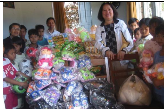
Tặng quà cho trẻ mồ côi nhà thờ xã Tà Nung