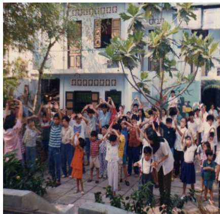
Trẻ cầm đuốc, chậm phát triển tại Trung Tâm Khuyết Tật Quận 4.