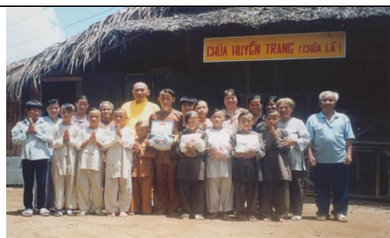
Tặng quà cho trẻ mồ côi và người già chùa Lá