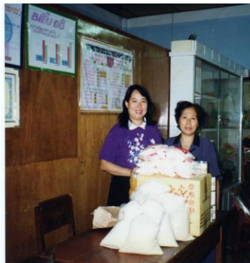
Tặng thực phẩm cho Trung Tâm KTQ4.