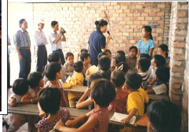
Lớp học tình thương nhà thờ xã Long Mỹ, Cần Thơ.