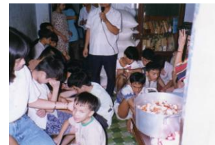
Giúp trẻ mù tại trung tâm Bùng Sáng