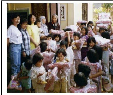
Phát quà cho trẻ mồ côi tại Diệu Giác năm 1997