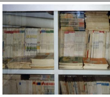
Tặng 2 tủ sách và 300 cuốn sách