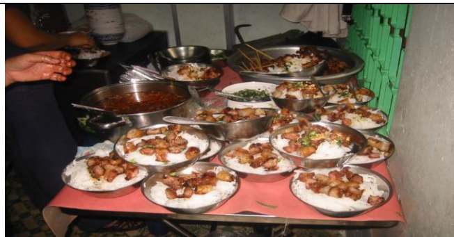
Tặng các bữa ăn ngon cho trẻ mù ở CLB Bùng Sáng