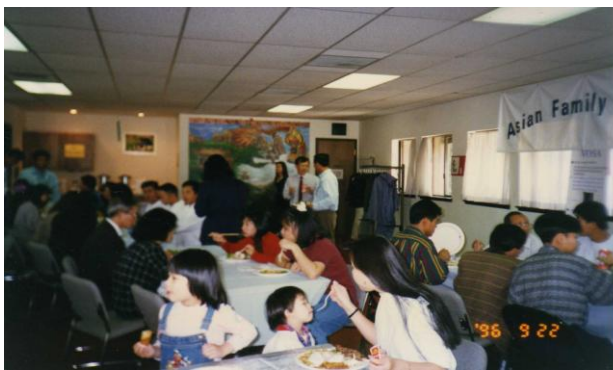
Bữa ăn gây quỹ của VOSA năm 1996

Tháng 9 năm 1996, VOSA tổ chức bữa ăn gây quỹ tại Asian Family Center tại Portland, tổng số tiền thu được từ bữa ăn gây quỹ này là $2,000.