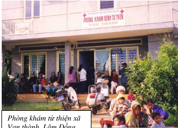
Phòng khám từ thiện xã Vạn thành, Lâm Đồng