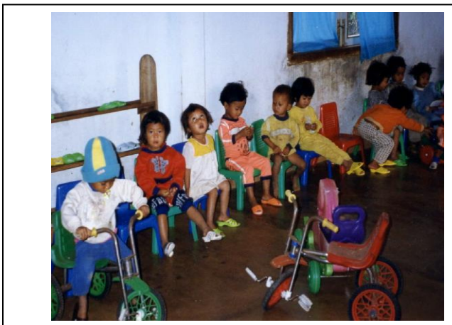
Trẻ suy dinh dưỡng xã Tà Nung, Lâm Đồng