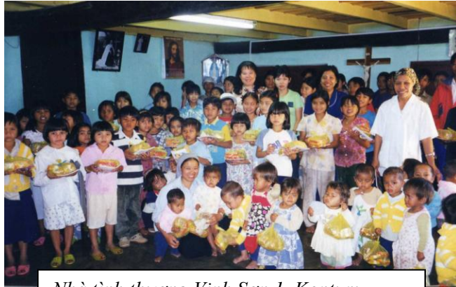
Nhà tình thương Vinh Sơn 1. Kontum